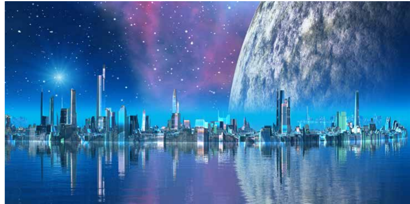
Планетарный дом – един, но в каждой «квартире» народы живут по собственным представлениям

Нельзя механически переносить этот цикл на всю мировую историю, но его окончание (как и начало) ознаменовало существенную перестройку всего миропорядка. Последовал развал социалистического