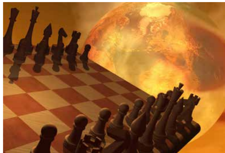
Текущий кризис ставит вопрос о поиске глобальной стратегии развития энергетики

Главное, что нынешняя ситуация – это начало «высокосного» этапа – четвертой части имперского цикла российской (и мировой) цивилизации. А это – период не только «зимней спячки», но и «ночь перед рождеством», период отмирания старых отношений и больших перемен в преддверии