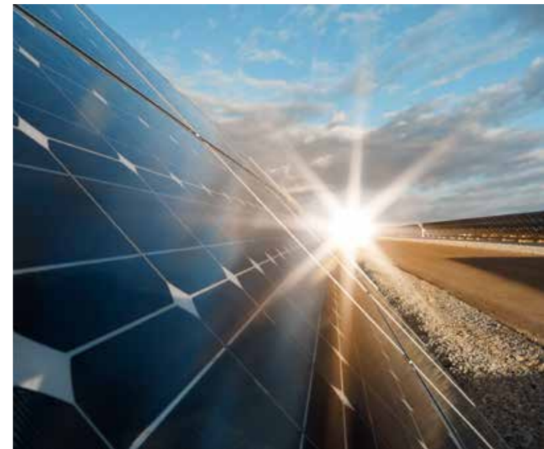
Солнечная электростанция

железных дорог с возможной трансформацией различных видов энергоресурсов и энергоносителей. Важную роль при этом будут играть системные преобразователи и накопители энергии. Не исключено и сооружение крупных приливных гидроэлектростанций на Дальнем Востоке для получения, сжижения и экспорта водорода. Нельзя упускать из виду и освоение газогидратов на северо-востоке Арктики, не только для получения топлива, но и для одновременного экспорта воды в дефицитные районы Юго-Восточной Азии.