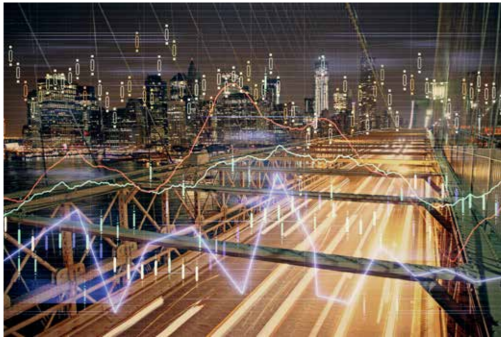
Энергетика переходного периода неизбежно будет стремиться к цифровизации

Газ же, напротив, будет пользоваться растущим спросом как основное топливо для электростанций, газомоторное топливо и ресурс для газохимии. По нашим оценкам, к 2035 году нефть в энергобалансе снизится на 15–20 %, а газ – вырастет на 5–7 %.