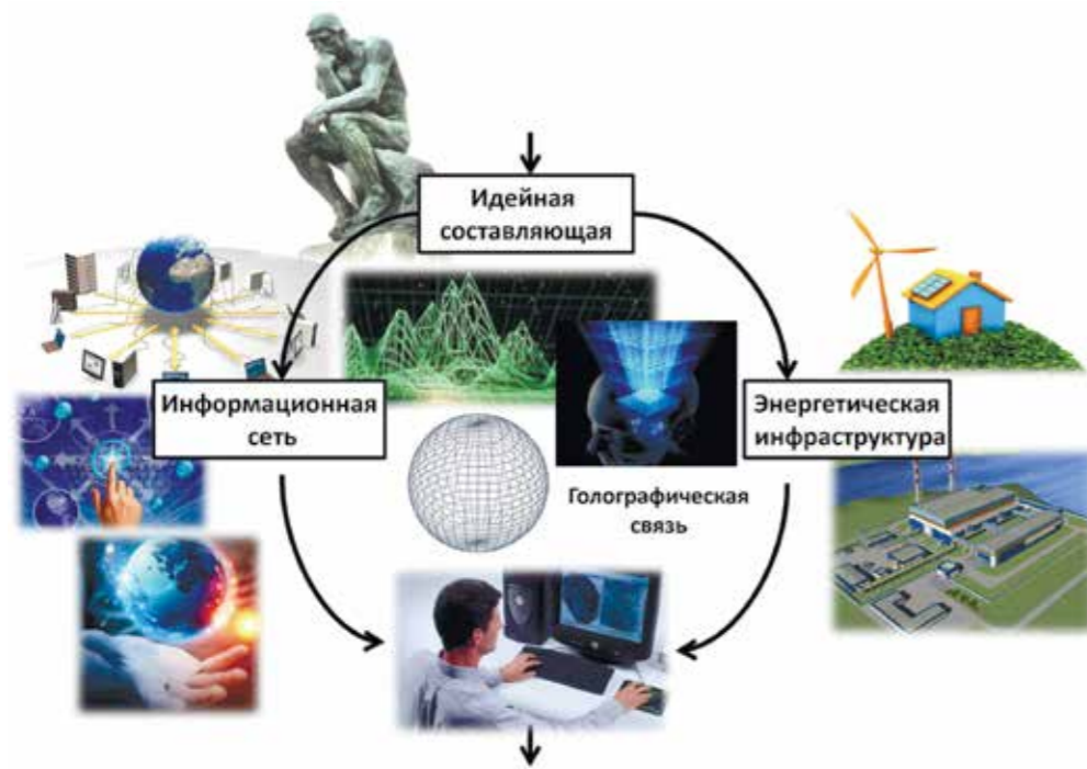
Рис. 2. Место человека в интеллектуальном энергоинформационном мире

хозяйства и нового быта, на предстоящем этапе развития цивилизации необходимо, прежде всего, столь же масштабно оценить новую роль социально ориентированной энергетики.