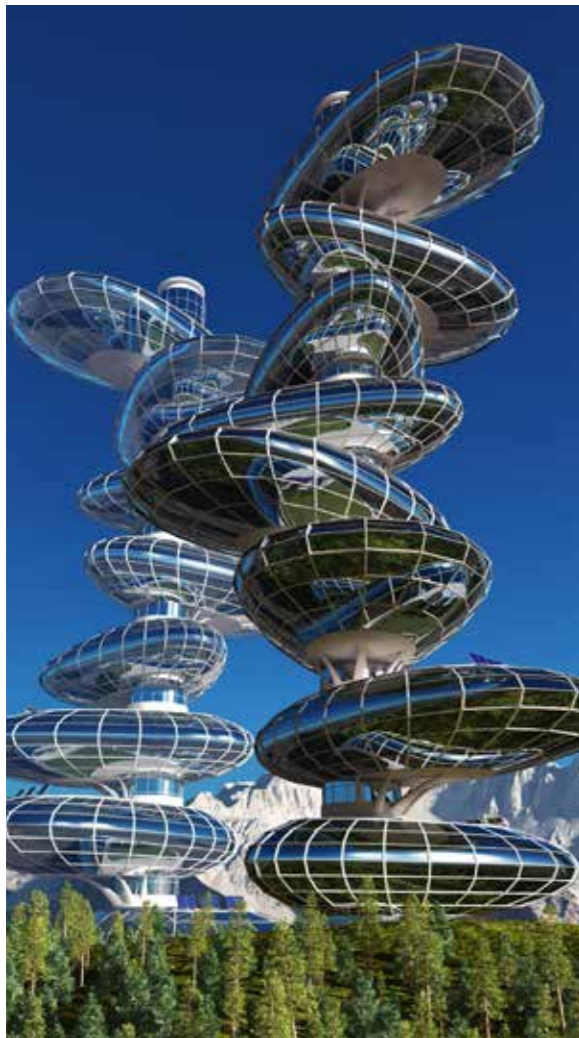
Дома будущего

Для общественных систем циклы тоже имеют четырехэтапность. Обычно они имеют продолжительность 4 года для первого вида циклов (причем четвертый – високосный год, самый «пакостный» по народным поверьям); для второго вида 10–12 лет (три периода по 4 года, это совпадает с периодичностью солнечной активности). Кроме того, известны и длинные так называемые имперские циклы – 144 года (третий вид), состоящие из четырех 36-летних периодов с разной степенью мутаций цивилизационных систем. Эти 36-летние этапы являются, с одной стороны, объединением трех циклов второго вида, а с другой – со-